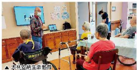
▲大林安納生命教育

除以上的例子，安道生命教育課程也會融合異地社會風俗民情、教會禮儀慶節…等元素，做不同嘗試的設計與融合，給長輩們安排體驗活動。如：新年新希望、復活節、聖母月母親節、父親節、主保慶祝、共融、聖誕節點燈彌撒、年終心靈回顧檢討…等。經由美好氛圍，盼長輩們可以真心喜歡來到中心與同儕和社區團體相互往來，減少脫離社會的「孤獨」狀態，好好感受生命意義和創造生命價值並提昇靈性層次的成長並減少世俗物質的需求，讓自己活出【家有一老，如有一寶】。