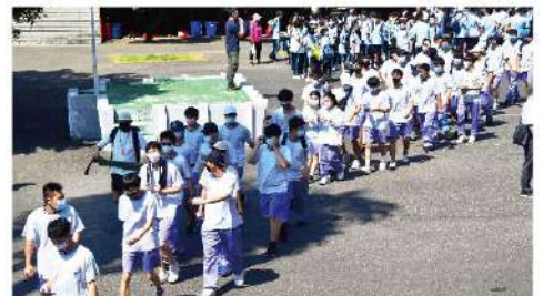
躍、興奮的心情。最後，和同學一起拍了合照，留下了美好的健行回憶。