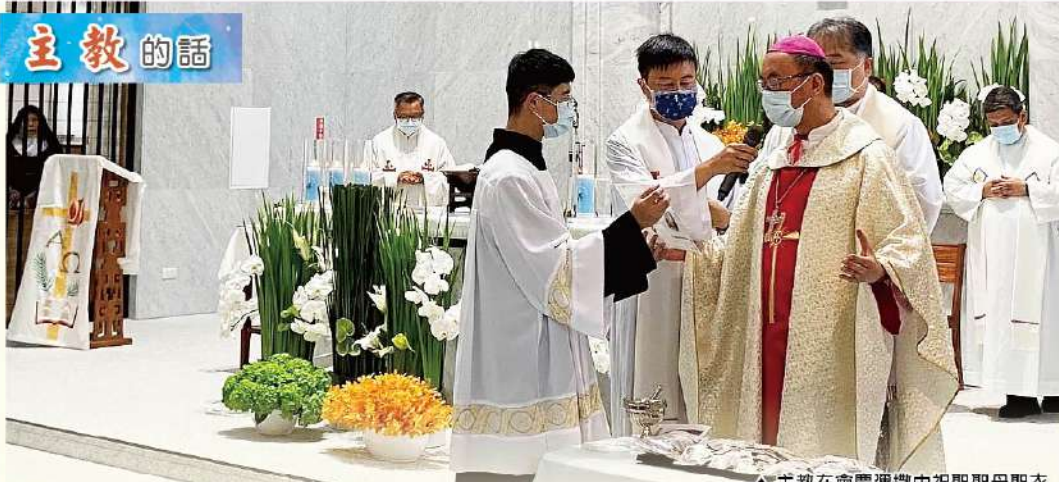
▲主教在會慶彌撒中祝聖聖母聖衣