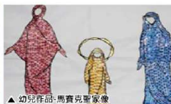
▲ 幼兒作品-馬賽克聖家像