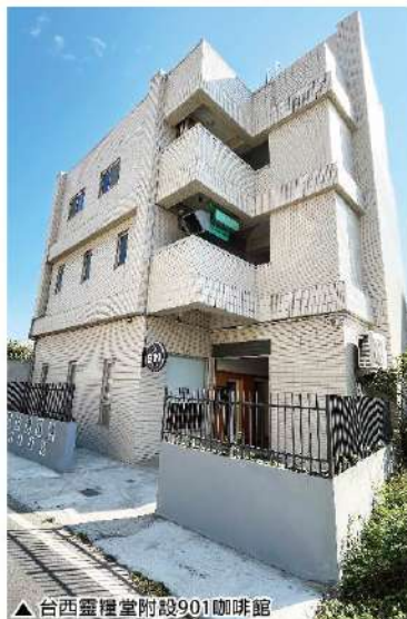
▲ 台西靈糧堂附設901咖啡館