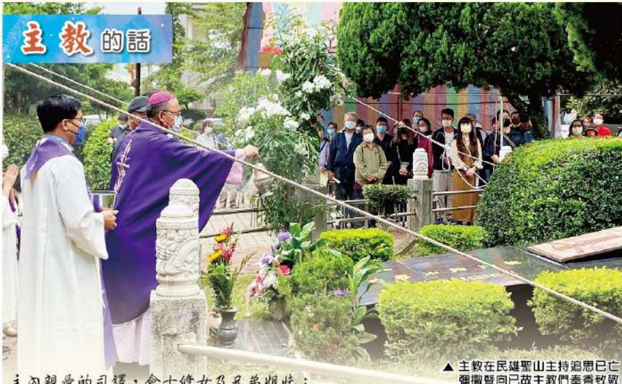
▲ 主教在民雄聖山主持追思已亡彌撒暨向已故主教們奉香致敬