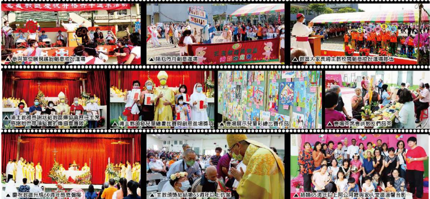
參與單位展現繽紛創意妝扮進場