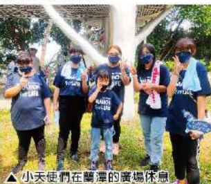
▲小天使們在蘭潭的廣場休息