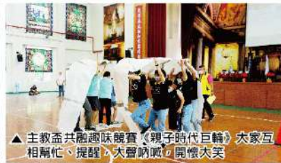
▲主教盃共融趣味競賽《親子時代巨轉》大家互相幫忙、提醒、大聲吶喊，開懷大笑