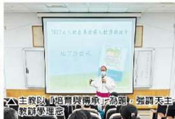
▲主教以「培育與傳承」為題，強調天主教辦學理念