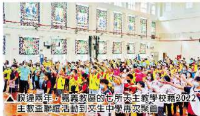
▲睽違兩年，嘉義教區的七所天主教學校藉著 2022 天主教盃聯誼活動到文生中學再次聚首

在閉幕典禮中，主教再次給予承辦學校肯定，感謝文生中學籌辦了一場「心的饗宴」，期盼未來各校能以更多元化的方式進行交流，一起創造嘉義教區學校的共好、共榮。