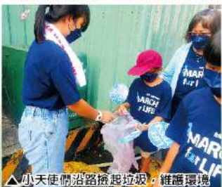
▲小天使們沿路撿起垃圾，維護環境