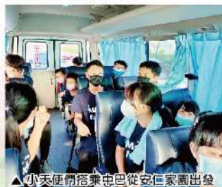
▲小天使們搭乘巴士從安仁家園出發