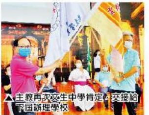
▲主教再次文生中學肯定，交接地下屆承辦學校