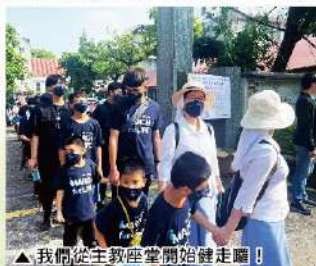
▲我們從主教座堂開始健走囉!