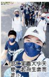
▲安仁家園小天使一起為生命而走!

每一位小天使都是閃閃發光的獨特生命，有著不同的生長背景和經歷，卻在同一條道路上相遇，為彼此帶來不同的成長，擦出不同的火花，寫下各自不同的故事，如同我們一起走過的這段路程，即使會感到疲累，也絕不輕言放棄。相信不只是這7.8公里的行程，還有往後所要走的每一條道路，我們都能夠互相支持和陪伴，一起向前邁進，帶著每一個生命看見屬於自己最美麗的風景。