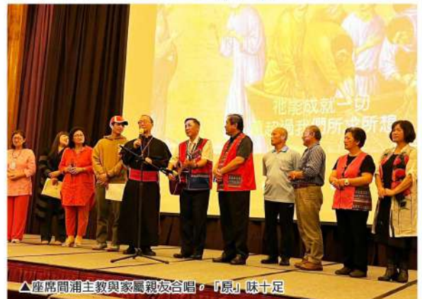
▲座席間浦主教與家屬親友合唱，「原」味十足