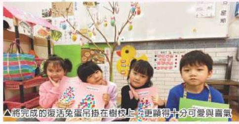
▲將完成的復活蛋吊掛在樹枝上，更顯得十分可愛與喜氣