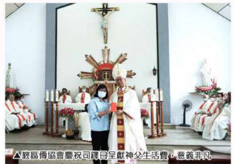
▲教區傳協會慶祝司鐸日呈獻神父生活費，意義非凡