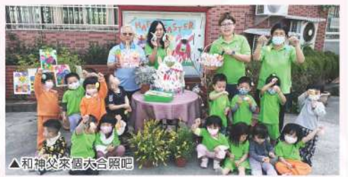
▲和神父來個大合照吧