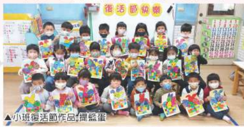
▲小班復活節作品-提籃蛋

上主替我們打開一條通往生命的橋，世界的命運在主復活的那天轉變了，而今天藉著恩寵，我們喜悅地慶祝歷史上最重要及最美好的日子，讓那些因經濟或政治或戰爭而受苦的人們，使他們不失去希望，全人類同心協力建設一個和平與友愛的未來。