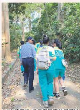
▲全校健行-校長與同學共同邁進