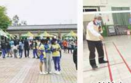
▲AI Maker營隊-展現作品時間