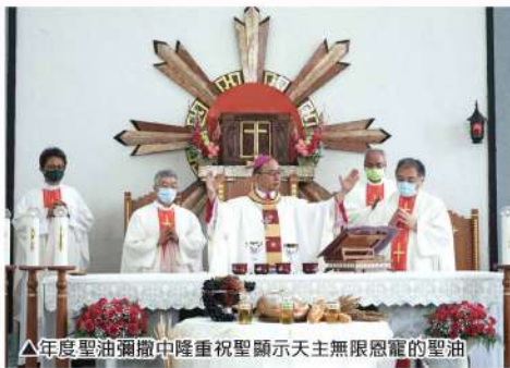
▲年度聖油彌撒中隆重祝聖顯示天主無限恩寵的聖油