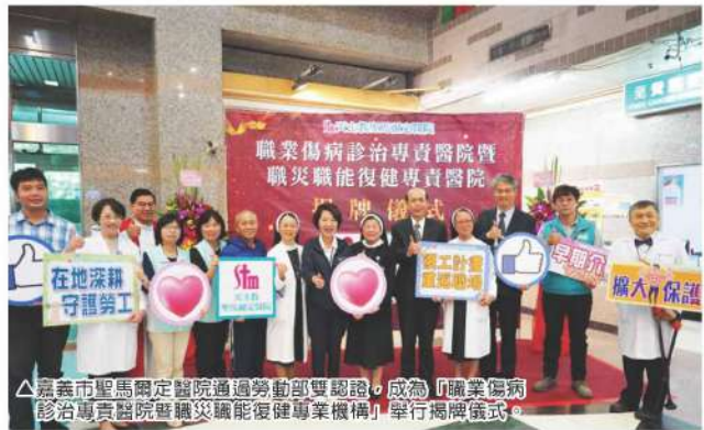
△嘉義市聖馬爾定醫院通過勞動部雙認證，成為「職業傷病診治專責醫院暨職災職能復健專業機構」，舉行揭牌儀式。

職業安全衛生不僅關係著勞工最基本的生存權，也連帶著社會安定及經濟的發展。不良的工作環境除了影響勞工本人也易造成職業災害發生，對勞工與事業單位都有損失，更影響勞資雙方的和諧。透過勞動部對勞工職業災害的各項立法推動與審核認可，成立全國穩定且高品質醫療診治及職能復健之服務網絡，讓勞工朋友工作環境不用擔心，意外受傷可以安心，重建之路溫暖你心。