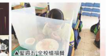
▲聖週五-全校惜福餐