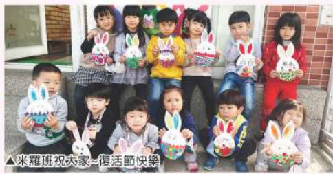
▲米羅班祝視大家-復活節快樂