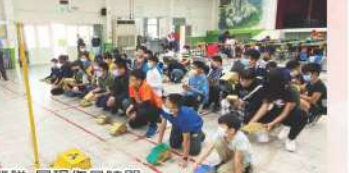
▲AI Maker營隊-展現作品時間