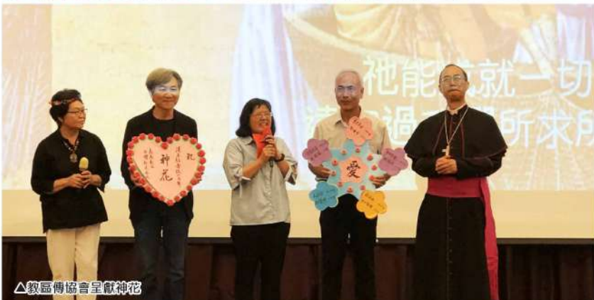
▲教區傳協會呈獻神花