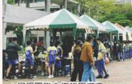
▲展現團隊合作的園遊會