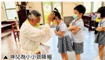
▲神父為小小孩降福