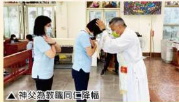
▲神父為教職同仁降福