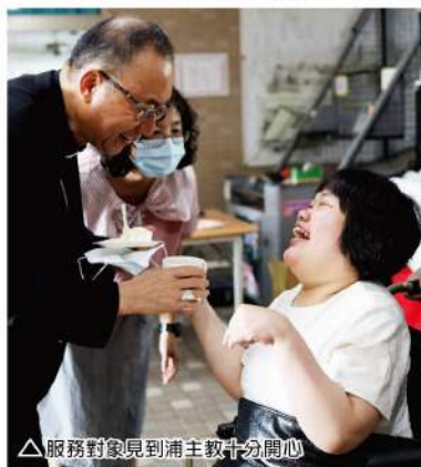
△服務對象見到浦主教十分開心

最後一天下午同仁搬來家中的剉冰機，準備了豐富的配料，也調製了可以吹出大泡泡的泡泡水，讓服務對象玩泡泡並體驗自己製作剉冰，七彩絢麗的泡泡在廣場中到處飛舞，整個空間變得夢幻了起來，玩累了坐下來吃碗剉冰頓時暑氣全消。當天活動結合了8月份的慶生會，正巧到附近辦事的浦英雄主教也是8月份的壽星，應院長的邀請，主教來敏道和壽星們一起吃著剉冰、切蛋糕、合影留念。在離開敏道前，還特地到養護組去為居家安寧的服務對象覆手祈禱。按照天主的時刻，小彩在主教的覆手祈禱後，第二天安詳的安息主懷。誰說這不是天主刻意安排的天使呢？感謝主教對服務對象的關心與愛心！順應了天主的旨意，也溫暖了我們的心，主教，您是我們的好牧者，願天主賜給您恩寵滿溢！教牧康泰！