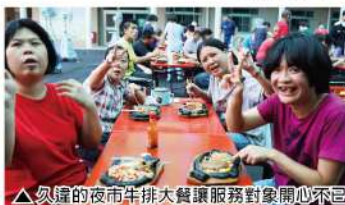
△久違的夜市牛排大餐讓服務對象開心不已