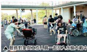
△服務對象與工作人員一起投入水槍大戰中