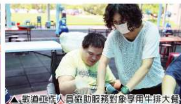
△敏道工作人員協助服務對象享用牛排大餐