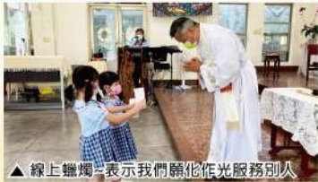
▲線上燃燭—表示我們願他作光服務別人