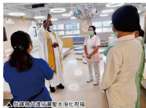
△教區神父進行灑聖水淨化祝福

只願所有人在這個農曆七月，因天主的祝福得享平安，讓來若瑟醫院的人也能分享心靈上永恆的平安。