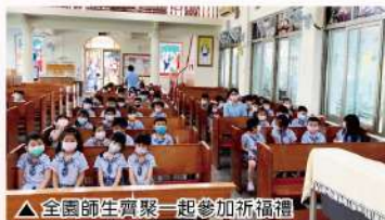
▲全體師生齊聚一起參加祈福禮