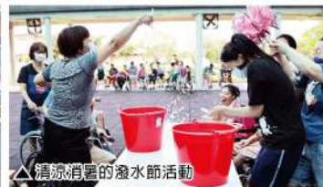
△清涼消暑的潑水節活動