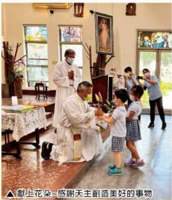
▲獻上花朵—感謝天主創造美好的事物