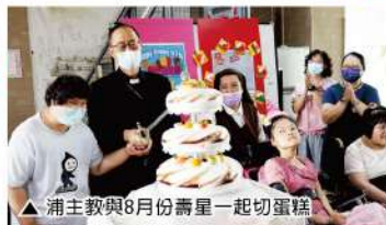
△浦主教與8月份壽星一起切蛋糕