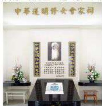
▲ 趙炳文總主教安葬於中華道明修女會家祠。