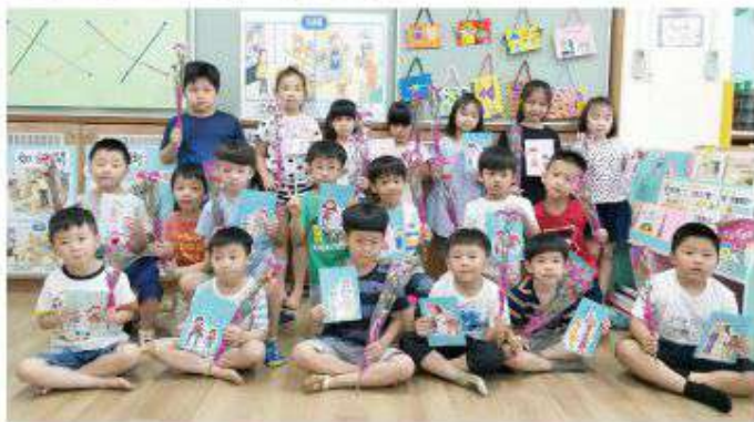
▲星海幼兒園的小朋友每一年都會自己製作卡片及花束送給自己的媽媽。

鳥語花香、春意盎然的五月，不知不覺已悄悄到來。在這最美麗的季節，有著最特別的節日——就是「母親節」。