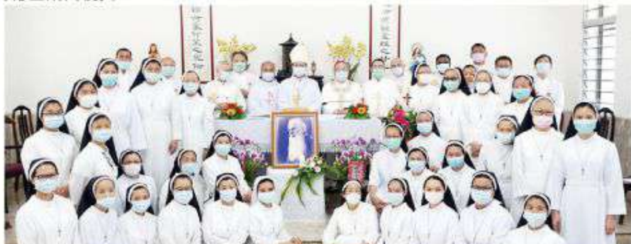
▲ 5月6日，中華道明修女會於斗南總會院的經堂，舉行紀念創會人趙總主教逝世四十週年感恩禮。