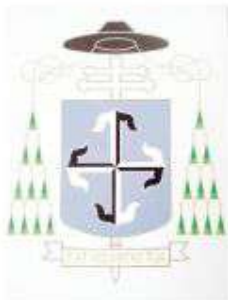
▲ 趙炳文總主教教徽。