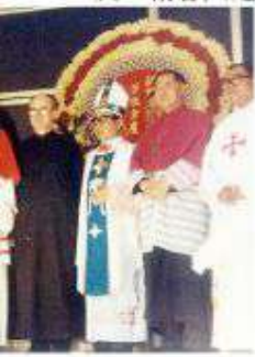
教慶祝米壽及晉牧金慶。

趙炳文總主教在他的遺囑中，對中華道明修女會的修女們表達殷殷切望，叮嚀他的女兒們謙遜服從、熱誠祈禱、為福傳使命獻身。遺囑最後表達了他誠摯的願望：「願今世與我相識的人，有朝一日都在天鄉歡聚。」值此紀念趙炳文總主教逝世四十週年之際，我們感念主教一生心繫中國，為中國教會熱誠的付出生命。祈禱與天主同在的趙炳文總主教為我們轉求，極力效法他愛主愛人之熱誠。