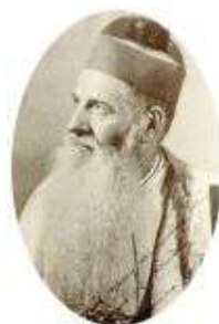
▲ 趙總主教送給修女們的照片，照片上簽名「給我的女兒們「福寧道明修女會」」。