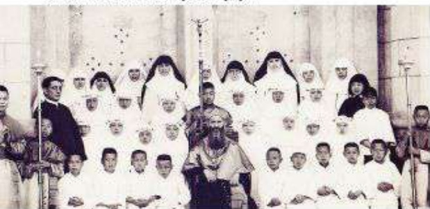
座堂，趙總主教為小朋友舉行初領聖體聖事。