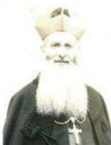
▲ 1946年，受教宗碧岳十二世任命為福州總主教。