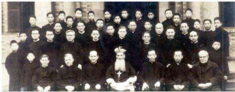
▲ 1932年，在羅文漢主教的故鄉「羅家巷」興建聖若瑟神學院。

1949年，時局日緊，主教遣送修會年輕修女及望會生等十三人，輾轉經港來台。修女及望會生來台之過程倍嘗艱辛，旅程中蒙寶血會修女慷慨照顧，來台後亦感恩聖功修女會、傳道道明修女會接待，並安排年輕修女至台北靜修女中就學；玫瑰道明修女會繼續協助完成初學修女之培育。其他修女們陸續在高雄大港埔天主堂、彰化羅厝莊及新化等地區，負責