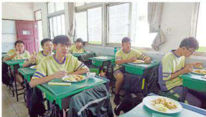
▲聖週五耶穌受難主日，全校共同享用惜福餐，雖然菜色減少，大家仍吃的津津有味！