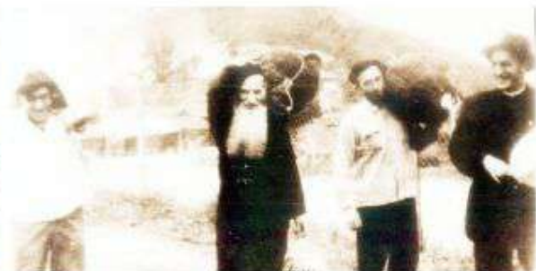
▲ 1951年11月，趙總主教與兩位神父被判出境，背負著行囊離開大陸。