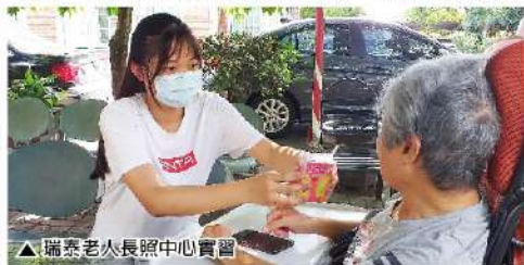
▲瑞泰老人長期中心實習