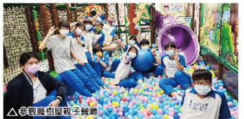
▲參觀慶樹屋親子餐廳