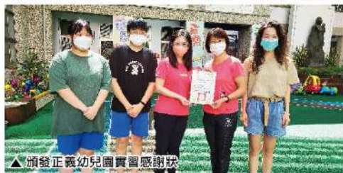
▲頒發正義幼兒園實習感謝狀

學生經過校外實習洗禮之後，彷彿打開心靈之窗，除發現校外實習機構工作的多樣化之外，同時也發現應提升自我能力才能勝任更高階的職務，亦從中瞭解自己不足的部分。走出校園接近不同族群才是真正學習的開始，藥學衛護類科學生感動於長輩們常給予實習生鼓勵與讚美，即使有些長者無法言語，但他們竭盡所能透過肢體動作，讓實習生知道他們由衷地感謝之意，他們常以比讚，或微笑或點點頭回應，經歷一個月的實習，讓實習生深刻地反省與家中長輩的關係，期許自己日後願意花時間了解長者的需要，因為愛與陪伴就是醫治的良藥，耶穌說：「你們的一切事，都應以愛而行」。格前16：14