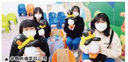
▲參觀大倫氣球公司