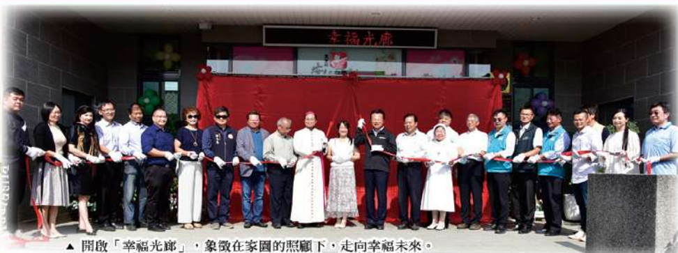
▲ 開啟「幸福光廊」，象徵在家園的照顧下，走向幸福未來。