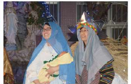
▲ 由老師主演的聖誕劇「耶穌誕生的故事」