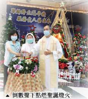
▲ 倒數聲下點燃聖誕燈火