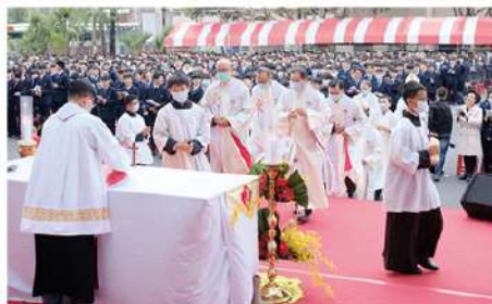
▲ 60 年校慶彌撒