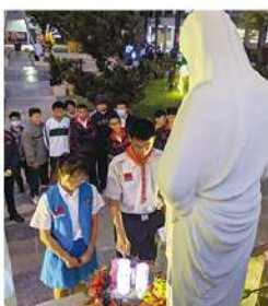
▲ 將臨期聖母亭點燈

今年欣逢學校過 60 大壽，校慶感恩祈福彌撒隆重且盛大，邀請鍾總主教主禮，校牧吳終源署理、校友神父們共祭，來賓、老師學生們熱情參與，高唱聖歌，同沐主恩！耶穌聖心、聖母聖心為我等祈！祈求天主賜福大地，2021，平安健康，早日脫離 COVID-19 疫情的困境！