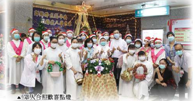
▲ 眾人合照歡喜點燈