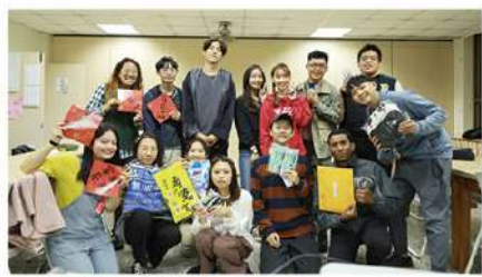
▲ 認識新朋友真開心