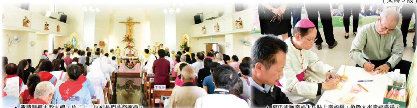
▲ 邀請鍾總主教主禮，及二十二位神長們共祭彌撒。