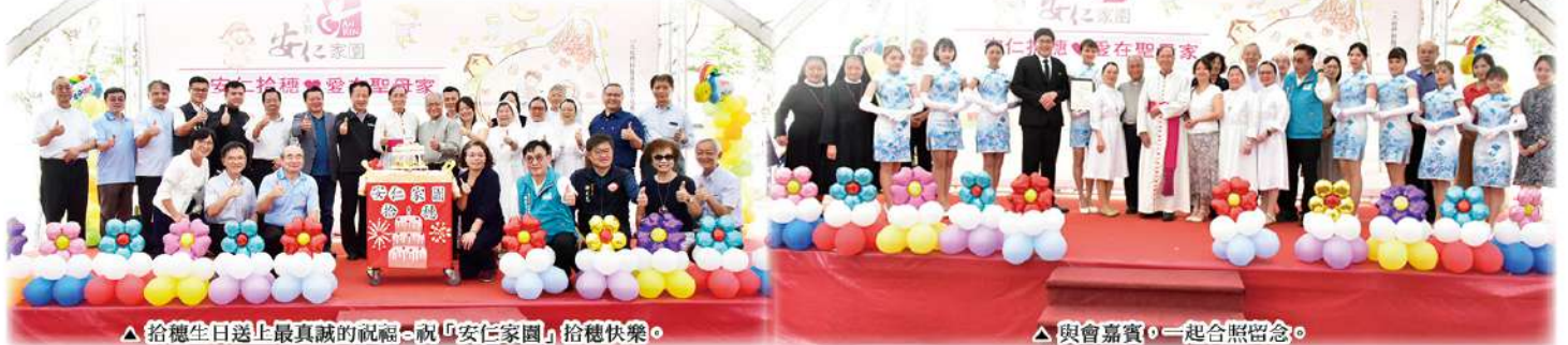
▲拾穗生日送上最真誠的祝福，祝「安仁家園」拾穗快樂。

最後，在此謹代表安仁家園工作同仁與院生，獻上無限致謝之意，感謝與會長官與貴賓，千言萬言道不盡我們要感謝的人，真得「不勝枚舉」，謝謝社會局長官、社福機構主管、學校單位與各界善心人士團體們，感謝您們，因有您們鼎力支持之下，「安仁家園」才能夠更勇於「全力以赴」邁向另一個「拾穗」。