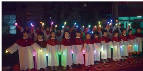
▲ 小天使演唱「天父的花園」的故事