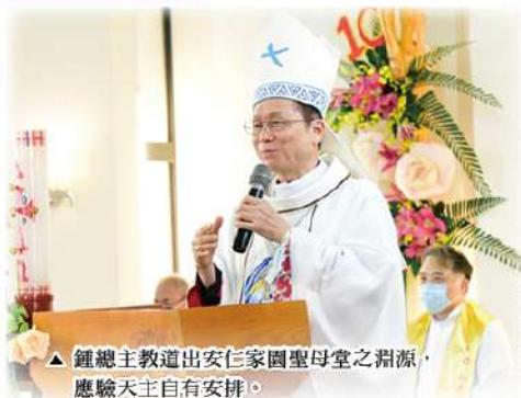
▲ 鍾總主教道出安仁家園聖母堂之淵源，應驗天主自有安排。