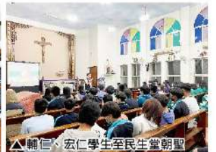
▲輔仁、宏仁學生至民生堂朝聖