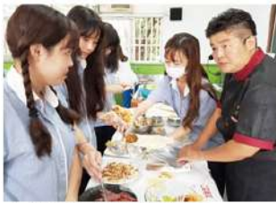
▲ 親子創意餐點實作課程

隨著新課綱上路，本校依據學校願景、學生圖像等，發展出特色課程，開設了「親子創意餐點實作」、「文創商品設計」、「AI 微型機器人」、「當代軍事科技」、「時尚生活」、「數位美學」、「AI 世界」、「健康促進實務」、「家政」、「越南語」、「安全教育與傷害防護」、「滾筒運動」及「電影與人生」等多元選修課程，並以跨班、跨學程方式開課供學生選擇，協助學生了解自己的興趣與能力所在，進而找到自己未來的方向，符應十二年國教適性揚才的目標。除校內師資外，也聘請實務經驗豐富的業界專家到校傳授職場實務技能，讓學生瞭解職場需求，進而提升職場競爭力。