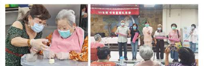
▲ 家屬與長輩動手做月餅

今年的疫情給全球帶來很大的影響，但是只要家人能夠健康平安的團聚在一起，就是再簡單美好不過的事了。活動最後在大家最喜歡的卡拉 OK 中圓滿結束，家屬陪伴著住民長輩，牽牽手，唱唱歌，吃著小點心，歡樂的氛圍也許很平凡，卻是中秋月圓人團圓，最佳的寫照。