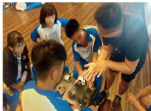
▲ 安全教育與傷害防護課程