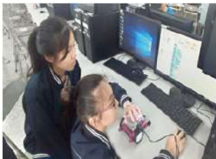
▲ AI 機器人課程

「籃球特色升學班」重視學生課業學習，不會過度偏重籃球，而是「訓練重質不重量」，透過適當調配學生訓練與課業學習時間，讓學生得以兼顧二者，在未來能利用籃球專長及專業學科的訓練，順利考上相關大學科系，例如：運動保健系、休閒運動管理系、物理治療系、醫護資訊應用系、運動與健康促進系、運動管理系、休閒運動與健康管理系等。