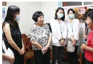
▲ 阿嬤和社姊們一見面就像打開心匣子

每到中秋節就是象徵家人團圓的時刻，但社會上有許多長輩是隻身一人的生活著，家人也許遠在天邊無法時常相伴。天主教聖馬爾定醫院社區醫療部長期關懷獨居老人，在中秋佳節前夕，特別與國際崇她嘉義社一同拜訪獨居長輩，並致贈祝賀禮品，在陪伴話家常的同時也把這份溫暖傳達給長輩們，讓長輩也能感受到溫馨之情。