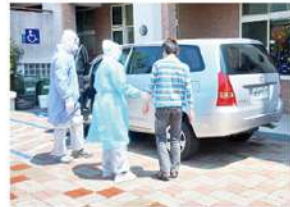
▲ 中心防疫就醫演練

新型冠狀病毒侵襲，造成全世界恐慌，而身處在社會服務領域，照護這群先天受限智能稍許有障礙者，無法完整表達他們共通問題，如何守護他們的健康與衛生的防護是必須且迫切為他們嚴格把關，防堵家長與親人接觸而造成無法掌控傳染途徑環節，而必須嚴格管制親接觸這關卡，採取工作夥伴分流分艙縮小照顧範圍，造成成本（支出遞增），而婉拒社會各界恩人參訪更是直接切斷金流與物流命脈（收入急速遞減），在照顧這群最弱勢弟兄姊妹服務是雪上加霜，深信處在全世界為弱勢朋友服務的社福機構是這次新型冠狀病毒 COVID-19 侵襲受害者，在中心秉持服務品質不打折提供優質服務而苦撐，能渡過這段苦日子；在這段因頓日子幸賴「頂新和德文教基金會」捐來及時雨能縮小支出大於收入窘境，更期盼新型冠狀病毒 COVID-19 能及早解除，期盼社會各界能更認識中心，繼續來澆灌這塊愛的園地。