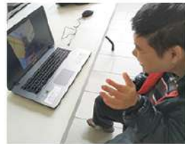
▲ 服務對象與家人視訊