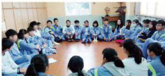
▲經過團體討論、學習溝通與分享，建立良好的人生態度及價值觀。