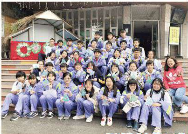
▲輔仁高中參與心靈成長活動學生們合影留念。