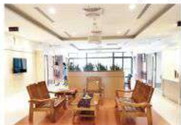
▲安納家園設有寬敞明亮的起居空間。