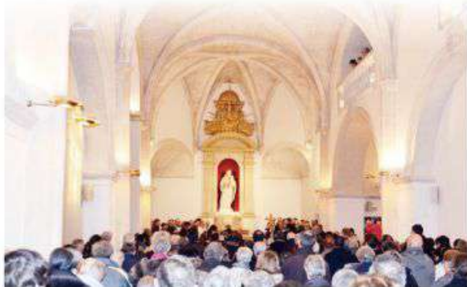
▲ 生命之母團體於法國母院「生命之母教堂」。