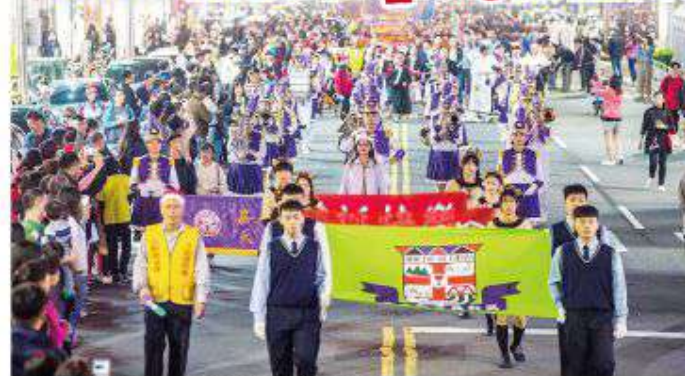
▲立仁高中旗隊隨著整齊的步伐走在中山路商團。