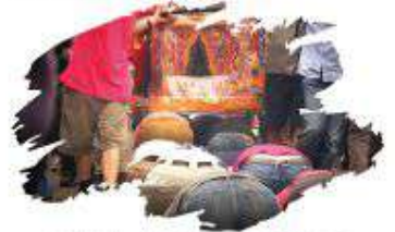
▲天主教禮儀不宜仿效民間信仰「鑽轎腳」。

外教人都會說：「舉頭三尺有神明」，我們的天主，聖母在天堂上，站的比我們高，我們要求天主，或請聖母幫我們轉求，實在不需要鑽聖母轎腳下，天主不要我們學習這樣的行為，天主教會禮儀之美及可貴，仍是在於普世有統一的禮儀，而且每一項禮儀，每一個動作都有它的意義，我們切勿隨便去增減。