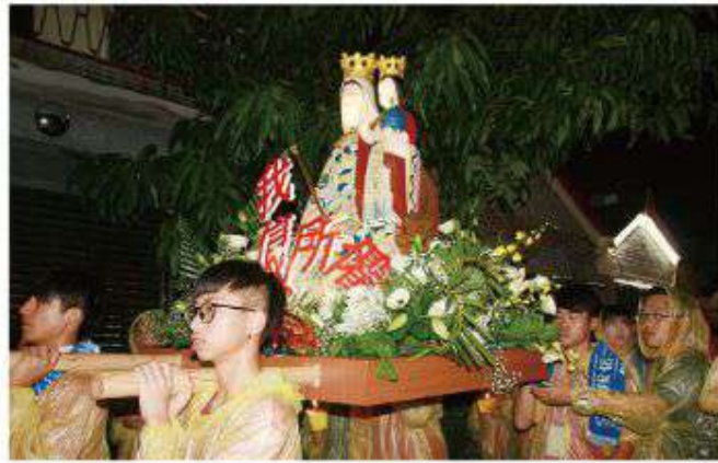
▲天主教禮儀進行當中，每一個動作都有它的意義，我們絕不可隨興的添加。

教會每一項禮儀的舉行都具有象徵性的特點。比如，「感恩祭」的舉行是天主子民聚餐，是向天父獻祭的標記，它不是普通的聚餐，亦不是普通的祭神禮，它象徵主的最後晚餐及主在十字架上的祭獻，更是參禮團體向天主的感恩和讚頌，更簡單的說：「禮儀是天主臨在的一個有形可見的記號」。(參閱《天主教教理》，1070條) 所以，禮儀進行當中，每一個動作都有它的意義，我們決不可隨興的添加。