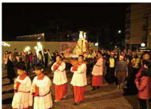
▲朝聖隊伍抵達朝聖地，所有參與者紛紛至廣場前恭迎中華聖母態像。