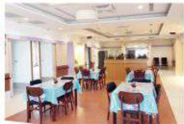
▲舒適宜人的家園餐廳，處處可見為長輩們的用心。