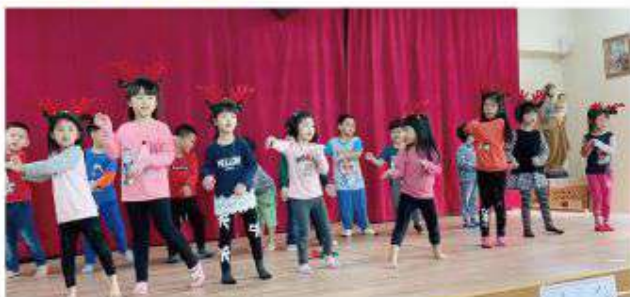
▲孩子們在舞台上天真活潑的模樣宛如一群小天使們。