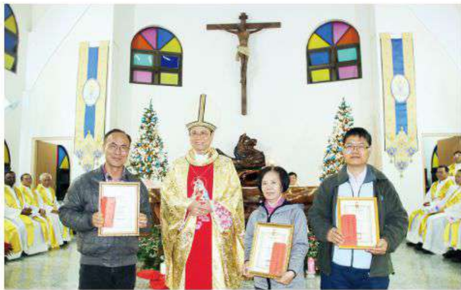
▲ 2019年12月31日嘉義教區於崑山中華聖母聖地舉行「2019年稱頌績效優良單位頒獎」，堂區傳協主席代表頒發，績效特優單位由左依序為：聖若望主教座堂榮獲「領洗之冠」、斗六聖玫瑰堂榮獲「福傳楷模」以及虎尾耶穌聖心堂、蘭/獅潭忠工作室

今年我們教區的重要工作目標是「福傳」，因台灣現在仍處於傳教區，有百分之九十以上的人口仍待福傳，他們猶如等待開墾荒蕪的園地，地上仍長了很多世俗的荊棘雜草。這個時候，我們要付出加倍的心力，非常的辛苦，還不知道收成會怎麼樣。所以同時，我們身為撒種的人，一邊播種，一邊流淚，是因為這個辛苦不光是身上流著汗水，也同時淌著淚水。在這裡我們講到「含淚播種的人」，其所播撒的種子，很多時候在《聖經》裡指的是「天主的話」，所以從屬靈意義上來講，撒種的人就好比是將天主的話撒到周圍的人，將天主的「愛」播在別人心裡的人。我們知道主耶穌自己就是一位撒種的人，祂來，是為把天主的話帶到我們當中。