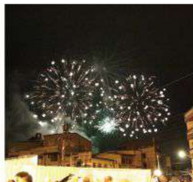
▲梅山公園跨年晚會璀璨煙火，情緒High到最高點！