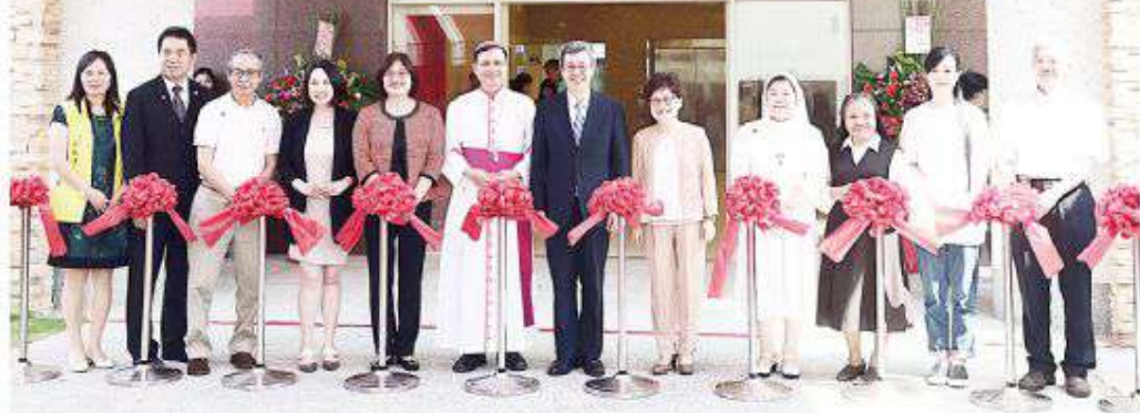
▲安納家園於108年10月26日舉行落成典禮，教區大家長鍾安住主教親自主禮，副總統陳建仁伉儷、嘉義縣長翁章梁、立法委員吳玉琴、陳明文、大林鎮鎮長簡志偉、嘉爾默羅安納家園修女院長滿詠萱修女，以及眾多恩人朋友、公部門長官、神長等貴賓參禮，共同見證這令人感動的開始。備受宗座所祝福的〈教宗特使斐洛尼樞機親臨祝聖〉，並基於「哪裡有需要，就往哪裡去」服務理念的嘉義教區安道社福基金會附設老人福利機構「安納家園」，即將開始服務長輩。

在大林當地小朋友熱鬧的太鼓聲中，108年10月26日，安納家園展開新的一頁，宣告正式落成。