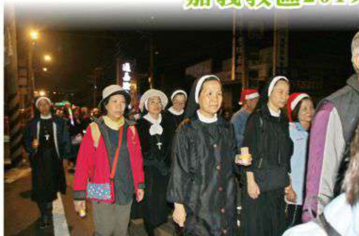
▲跨年夜間徒步朝聖活動邁入第二十五年，今年約有四百餘位神父、修女及教友們共襄盛舉。