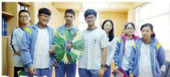
▲學生們展示共同親手製作「愛」的將臨圈。