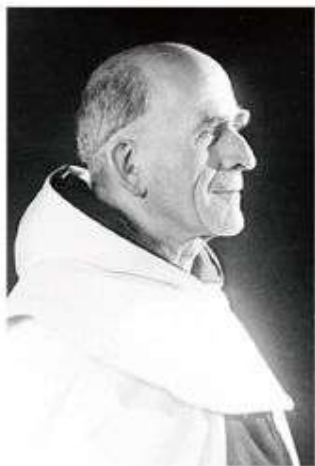
▲ 2016年3月4日教宗方濟各授福教會進行可敬的瑪利尤震神父列真福品。

耶穌說：「誰愛我，我父也必愛他，我也愛他，並將我自己顯示給他……誰愛我，必遵守我的話，我父也必愛他，我們要到他那裡去，並要在他那裡做我們的住所。」(若十四21, 23) 真福瑪利尤震神父常用耶穌的這句話來講解靜觀祈禱的重要性。想一想成為天主的住所這是怎麼一回事？人性和天主性的結合又是如何的美妙奧秘？小德蘭說我們不必避諱說：「天主渴望我們的愛，渴望與我們結合！因為天主就是愛。」祂不只愛我們，也降生成人，渴望與我們連結、共融，這就是慈悲天主的作風！因為天主聖三本身就是相愛、共融、彼此相連合一的。聖三彼此共融，也渴望與人類與大自然連繫共融！多麼令人振奮的福音！天主不嫌棄卑微的人類，把我們提升到可以與祂相愛、相通境界，賞賜我們萬千的寵惠！因此，真福瑪利尤震神父想盡各種辦法教導人們深入靜觀祈禱，與天主緊密相連，成為結實纍纍的葡萄樹！(參閱若十五)