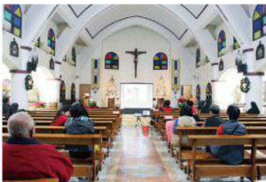
▲徒步朝聖進行同時於梅山中華聖母朝聖地舉行室內祈禱活動。

接著鍾主教、共祭神父和全體教友一起在聖堂廣場倒數計時，梅山鄉公所也在緊鄰聖堂的梅山公園舉辦跨年活動，適時的燃放高空煙火來助興，場面相當熱絡。神長、修女、教友也相互擁抱握手、互祝新年快樂，情緒High到最高點！此時教區傳協會的姊妹們推出熱騰騰的肉粽和薑母茶，溫暖了原本飢腸轆轆的教友們，在身心靈皆充滿能量下，愉快的賦歸。