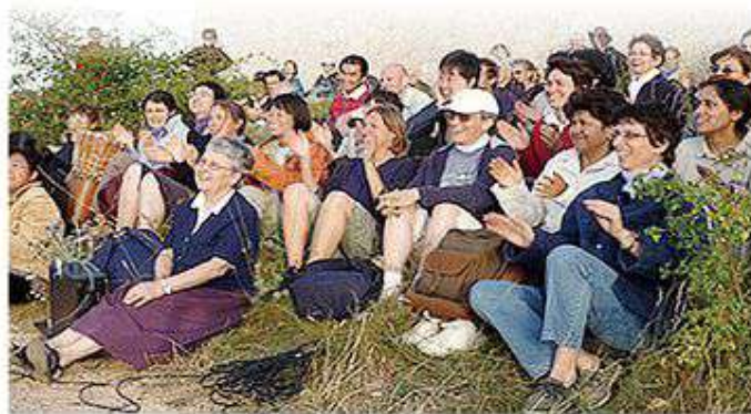
▲ 生命之母團體於法國節日觀看表演和教心。