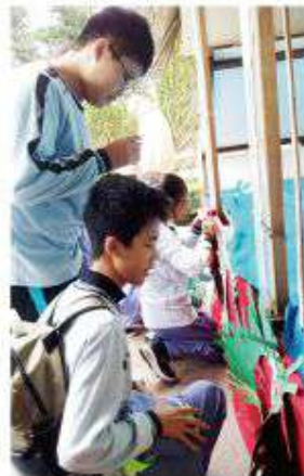
▲學生們齊心布置校內聖誕馬槽。

最後我們請求主耶穌，祢要求我們在對兄弟姊妹作出判斷之前，先把自己眼中的大樑取出。去面對自己的缺點和不足，這需要極大的謙下和勇氣。主，求祢賜我力量，去取出自己眼中的大樑。阿孟。「怎麼，你看見你兄弟眼中的木屑，而你眼中的大樑，倒不理會呢？你怎能對你的兄弟說：兄弟，讓我取出你眼中的木屑罷！而你竟看不見自己眼中的大樑呢？」（路六41-42）